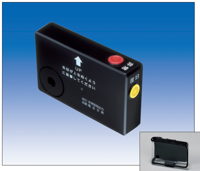
ソフトケース (付属品)