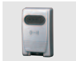
●RU-1008 リーダーユニット

受信制御機器事業部 事業本部 〒607-8156 京都市山科区東野五条通外環西入83-1 TEL(075)594-7211(代) FAX(075)501-2085 札幌 (011)281-4641 仙台 (022)268-2411 郡山 (024)962-4310 高崎 (027)327-3981 さかい (048)653-7531 千葉 (042)202-2551 東京 (03)5805-8081 立川 (042)540-1665 横浜 (045)471-8467 長野 (026)229-8130 静岡 (054)203-5220 名古屋 (052)731-7227 金沢 (076)234-7201 京都 (075)593-3171 大阪 (06)6360-6881 神戸 (078)230-6112 広島 (082)223-1138 高松 (087)861-6633 福岡 (092)471-6245 熊本 (096)387-3911 U.S. 408-747-0100 U.K. 01256-475555 AUS. 03-9546-0533