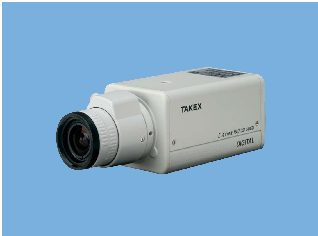
レンズは別売品です