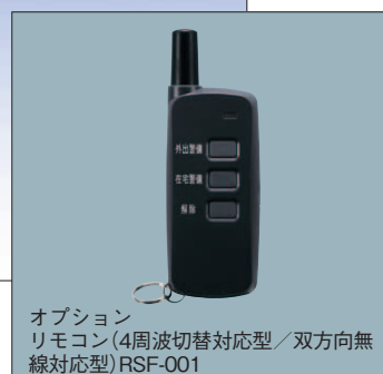
オプション リモコン(4周波切替対応型／双方向無線対応型) RSF-001